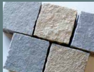
Tandur platines 14x14x7/9