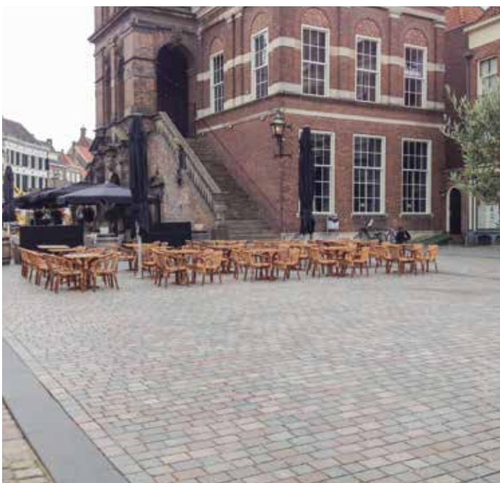
Groenmarkt, Zutphen "Plus" keien