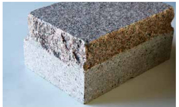
Plaveisel met de opsluiting en verwerking van een tegel