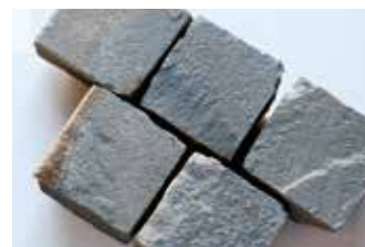
Pietra grès platines (eur)