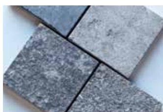
Gris Catalan (S)