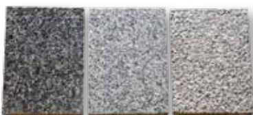
Gezoet Gevlamd Gebouchardeerd

De Chinese Highland grey kan ook makkelijk geleverd worden in grootformaat tegels geschikt voor zwaar verkeer toepassingen. Banden en treden e.d. zijn courant leverbaar.