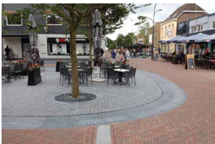
Geleidingslijnen in het straatvlak ook op maatwerk elementen. Ermelo