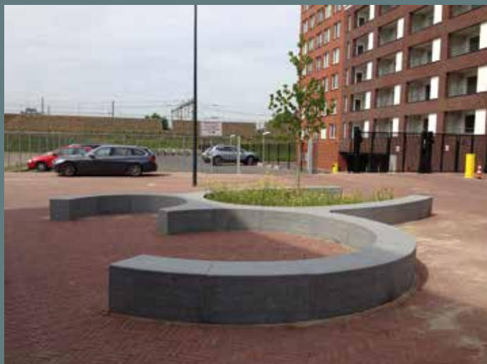
Brouwerij terrein De drie hoefijzers, Breda