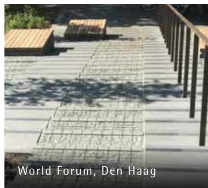
World Forum, Den Haag