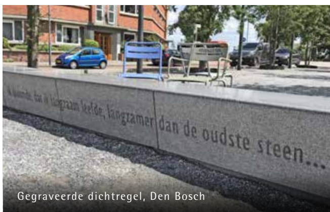
Gegraveerde dichtregel, Den Bosch