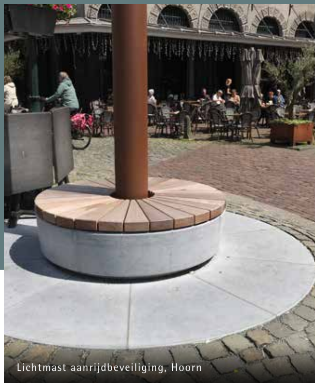
Lichtmast aanrijdbeveiliging, Hoorn