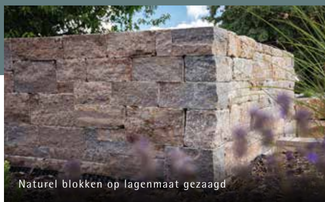
Natuurlijk blokken op lagenmaat gezaagd