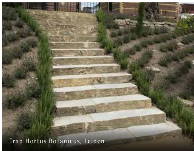
Trap Hortus Botanicus, Leiden