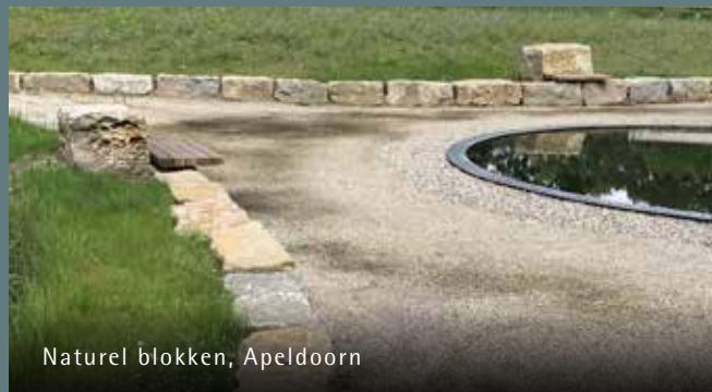
Natuurlijk blokken, Apeldoorn