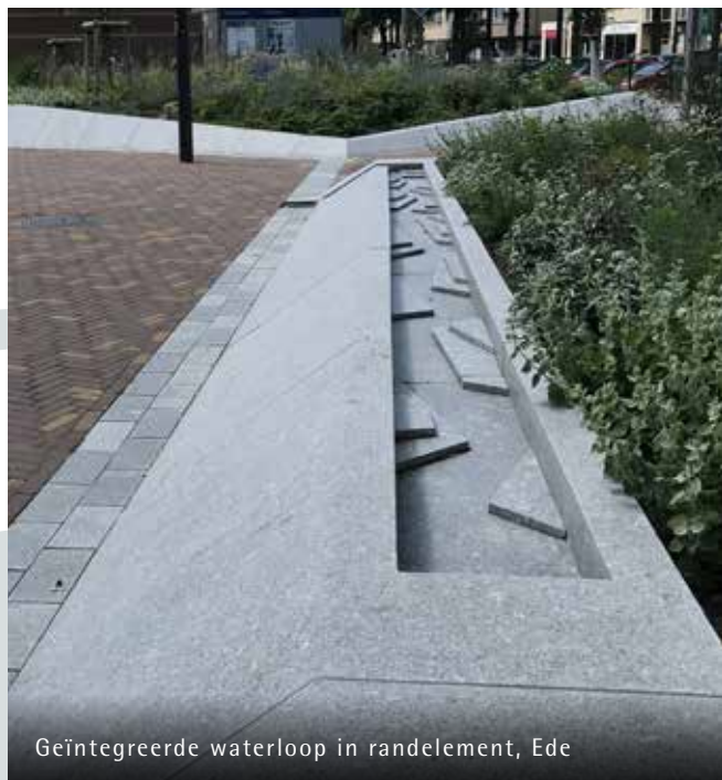
Geïntegreerde waterloop in randelement, Ede