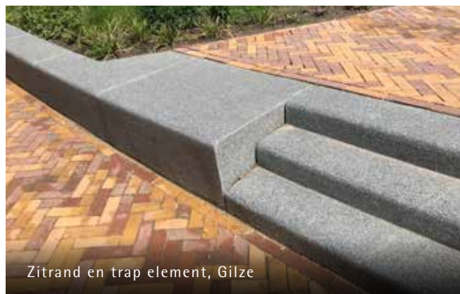
Zitrand en trap element, Gilze