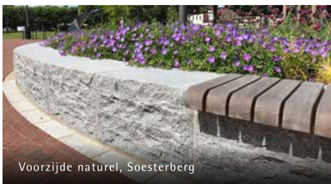
Voorzijde natuur, Soesterberg